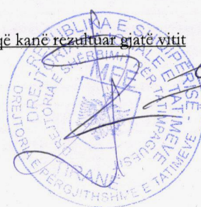
Tabela 1- Të ardhura Neto pas llogaritjeve të të ardhurave dhe shpenzimeve që kanë rezultuar gjatë vitit 2021.

Për periudhën tatimore 2021 Agjencia ALBAUTOR rezulton me Rezultat neto në shumën 17,125,923 (shtatëmbëdhjetë milion e njëqind e njëzetë e pesë mijë e nëntëqind e njëzetë e tre) lekë . Kjo shumë do të reduktohet pas llogaritjes dhe zbritjes së tatimit në burim që do të duhet të derdhet në organet tatimore në kohën e shpërndarjes së të ardhurave për autorët. Për më tepër të dhënat e përmbledhura gjenden në 2 tabelat e mëposhtme: